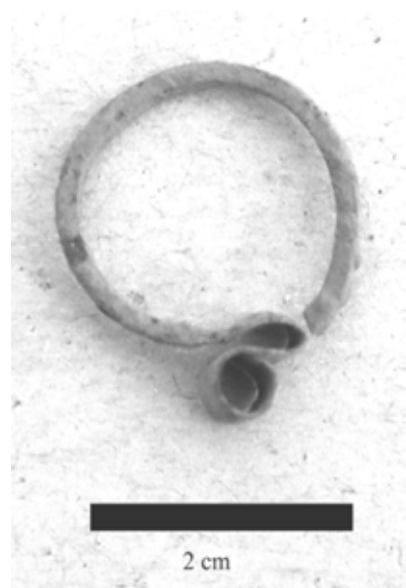
Бронзана карика из гроба

за градњу, те је касније утврђено да мноштво камења у зидовима сеоских штала и обора заправо припада остацима древног насеља. Пронађени су делови зидова некадашње цркве, стотину гробова око ње и један велики обрађен камен цигластог облика. Археолози из Суботице и Мађарске су извршили детаљна ископавања и анализу земљишта 1985. године. Ископана је грнчарија, шнале, метали, посуђе, ћупови, новац, али не и злато, што јасно говори да је народ живео сиромашно. Посебно су карактеристичне бронзане карике, накит који су жене носиле у коси, а не на ушима, што указује на период између 11. и 14. века. Оружје није нађено.