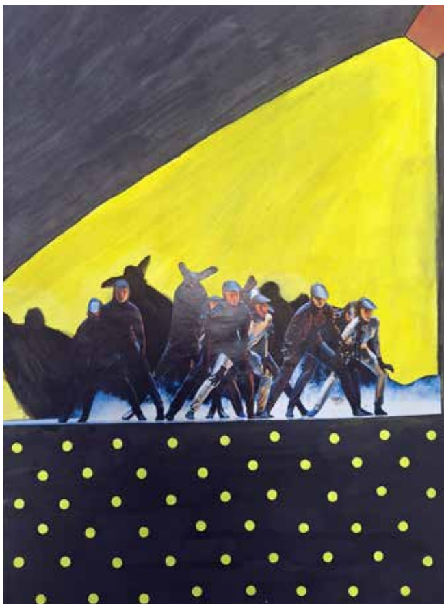
Данијела Рахимић, 3-1