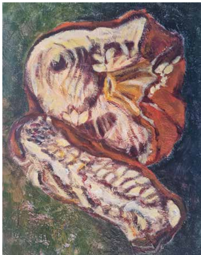
Brindza Léna, 4-2