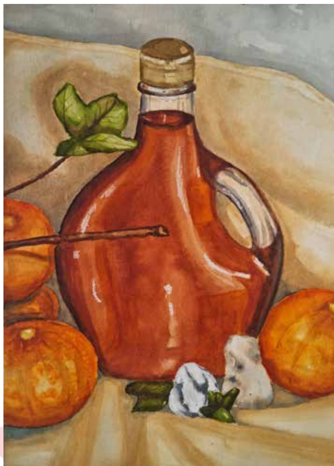
Brindza Léna, 4-2