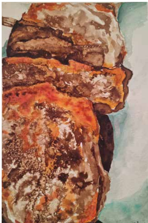
Brindza Léna, 4-2