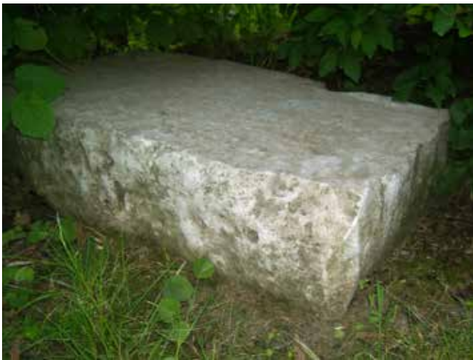
Велики обрађен камен цркве Feketeegyház