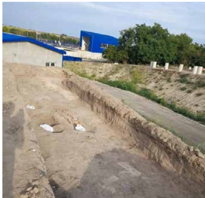
Сонда 210, истраживачки ров и пречистач